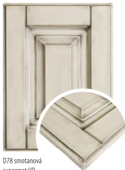
D78 smotanová supermat HP