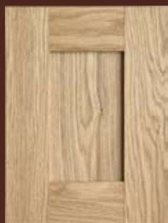
DYHOVANÉ dvierka skladané