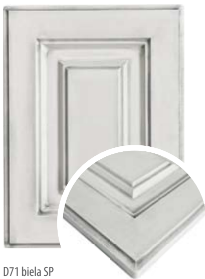
D71 biela SP