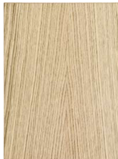
Dub európsky C