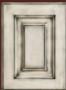
PATINOVANÉ dvierka Vintage