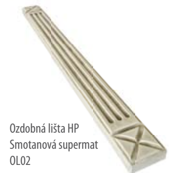
Ozdobná lišta HP Smotanová supermat OL02