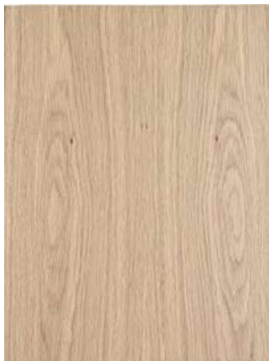
Dub európsky fláder