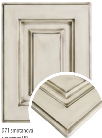
D71 smotanová supermat HP