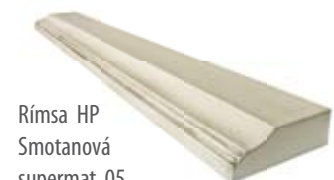
Rímsa HP Smotanová supermat 05