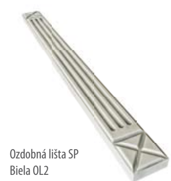
Ozdobná lišta SP Biela OL2