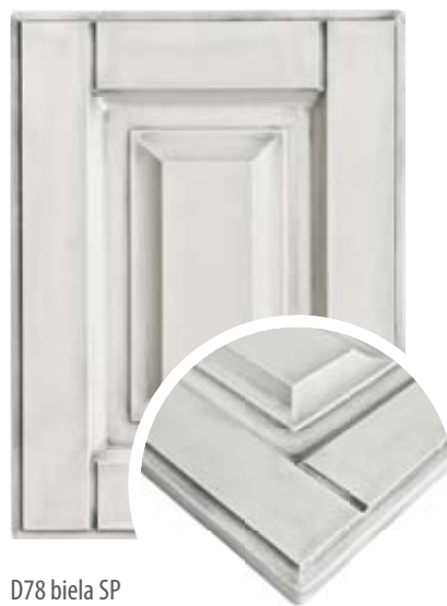
D78 biela SP