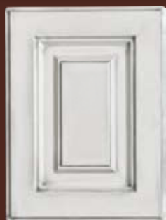
PATINOVANÉ dvierka Provensal