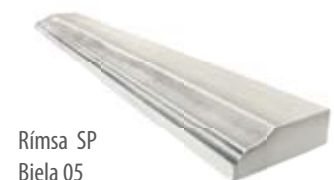
Rímsa SP Biela 05