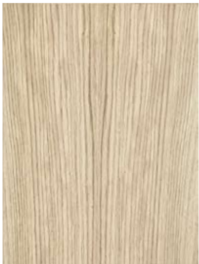
Dub európsky radiál

Prírodná dyha je vyrobená krájaním kmeňa stromu a preto je jej kresba a farba taká výnimočná a originálna