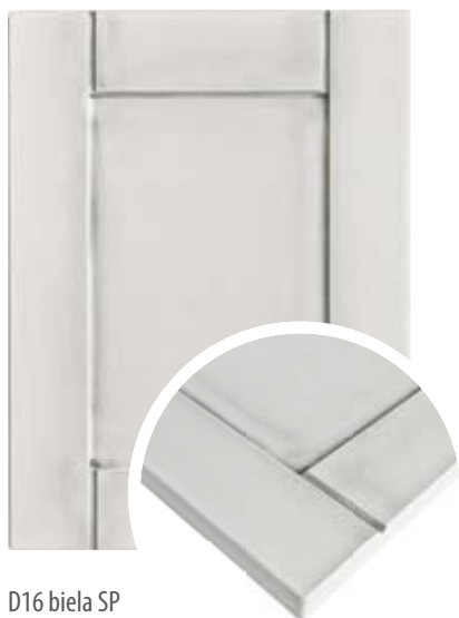
D16 biela SP

PATINA PROVENSÁL - dodatočná povrchová úprava, SP : sivá provensál, HP : hnedá provensál