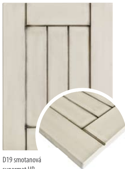
D19 smotanová supermat HP