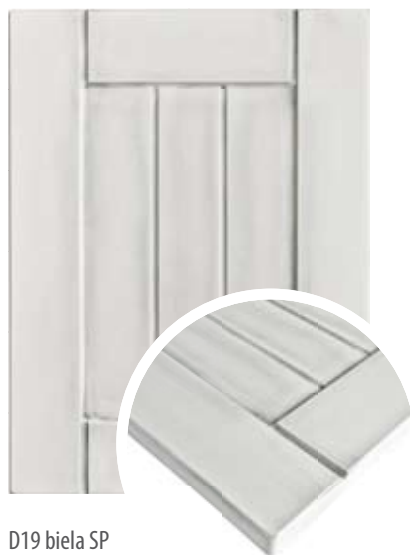
D19 biela SP