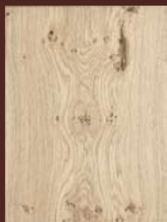
DYHOVANÉ dvierka hladké